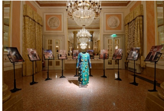
Resim 10. Fenice Tiyatrosu'ndaki sergiden görünüm.