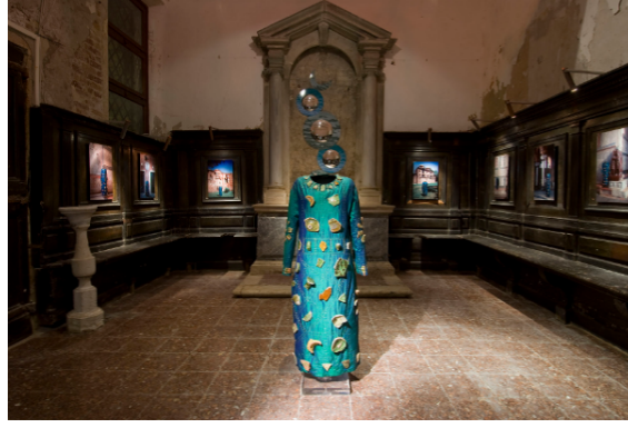
Resim 11. Oratoryo di San Ludovico sergisinden görünüm.