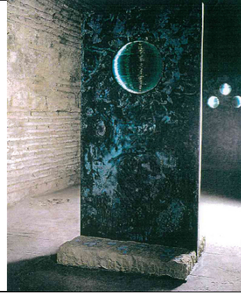
Resim 4. “Kanun sesleri Poseidon’un ülkesinden suyu getirdi, Ludingira’nın arkadaşı olan kadın sulardan bir top yaptı. Deniz rengi bakırın içine koydu”, Aya İrini, 1991, I,II, III parça, bakır, cam, taş, 200x100x80cm, Özel Kol. (Handan Börüteçene arşivi, sanatçının özel izniyle)