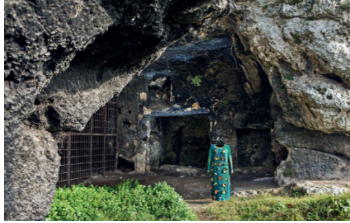
Resim 12. Elbise serginin ilk çıkış noktası olan Yarımburgaz Mağarası Önünde