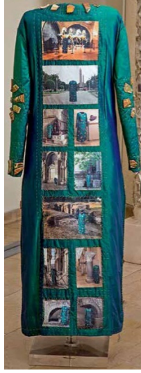
Resim 9. Elbisenin arka yüzü

Venedik, San Marco kilisesinde sergilenen “Dört Atlı” heykeli yer almaktadır. İkinci fotoğrafta elbise bu kez, atların bulunması gereken asıl yer olan Hipodrom’da fotoğraflanmıştır. Devamında ise bir kısmı Venedik’te olan, bir kısmı ise Arkeoloji Müzesi’nde kalan eserler yan yana ve ardışık biçimde dizilmiştir. 1204 yılında ait oldukları yerlerden alınarak Venedik’e götürülmüş eserlerin bazıları yarısı İstanbul yarısı Venedik şeklinde ilişkilendirilerek gösterilmiştir. İstanbul’daki Aziz Polyektos Kilisesi’nin tavus kuşu tasvirli mimari kalıntısı ve Venedik’e götürülen yarısı elbisenin en alttaki iki görselidir. (Resim 9)