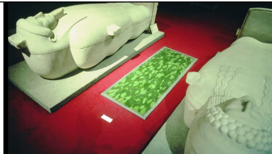
Resim 5. “Defnenin Kokusu Kaldı”, 1994, Çağlarboyu Anadolu’da Kadın Sergisi, İstanbul Arkeoloji Müzesi Sidon Salonu, cam, defne yaprakları, kurşun, 160x70x75cm