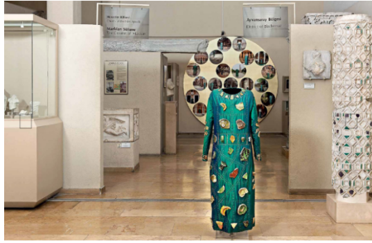
Resim 15. Sergi mekânının genel görüntüsü